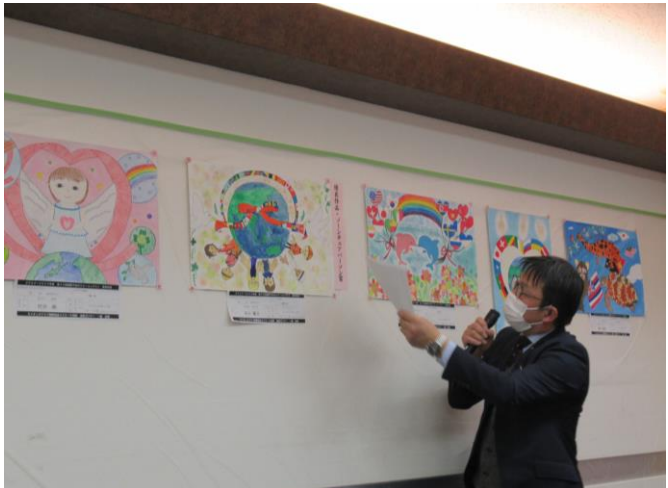
2023年2月4日ボーイスカウト守山第1団 ベーデンパウエル祭/夜間ハイク激励